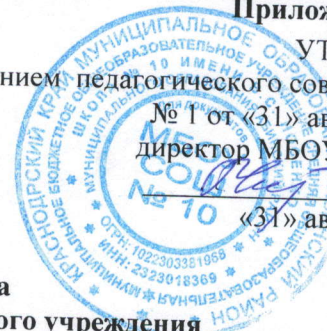
Таблица-сетка часов учебного плана муниципального бюджетного общеобразовательного учреждения средней общеобразовательной школы № 10 имени В.С.Носенко муниципального образования Абинский район для 1-х классов, реализующих федеральный государственный образовательный стандарт начального общего образования, на 2020-2021 учебный год