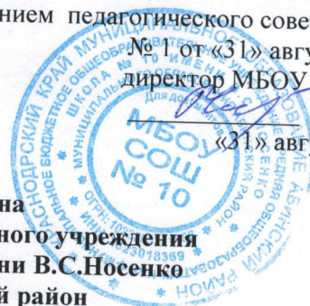
Таблица-сетка часов учебного плана муниципального бюджетного общеобразовательного учреждения средней общеобразовательной школы № 10 имени В.С.Носенко муниципального образования Абинский район для 3-х классов, реализующих федеральный государственный образовательный стандарт начального общего образования, на 2020-2021 учебный год